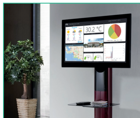
Écran de communication